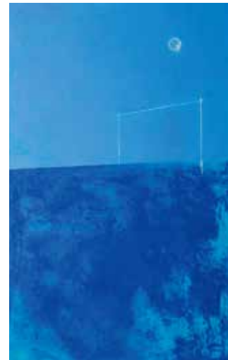
ヨビゴエ 53.0x33.5cm 2022 pastel on board

太古 y 未来 からの のっぴきならない…呼び声…が、身を苛む 描く動機が、他にありまじょうか