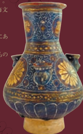
藍釉金彩紋子持壺 ラジバルディー手 徳大寺公英箱書

中世、イランで花開いた美しい イスラム陶器。 砂漠のなかで生まれた美の結晶 は、気品に満ちあふれています。 多様な造形と洗練された装飾文 様は大きな魅力で、 世界を魅了してきました。 鉛釉、青釉、ラスター彩などにあ る宗教的な美意識、抒情性も 見どころです。絢爛なる焼きもの の宇宙をお楽しみください。