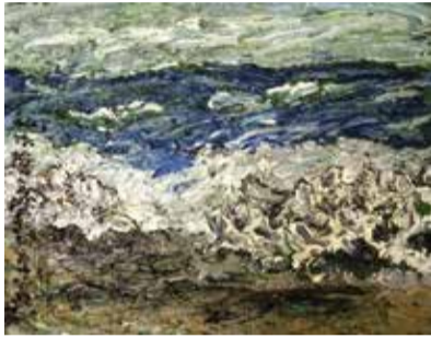
「私は海をだきしめて」 45.5×53.0cm

9月26日(土)~10月20日(火) 12:00~17:00【水・木曜休み】 作家在廊日 26日(土)、27日(日)